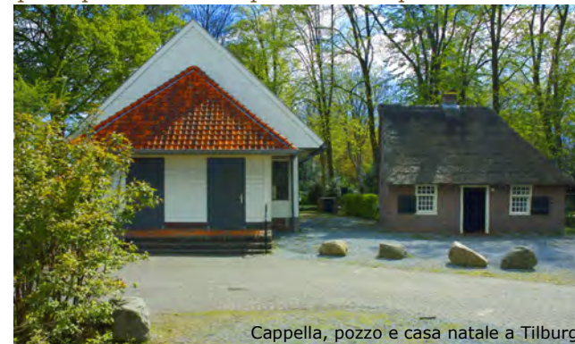
Cappella, pozzo e casa natale a Tilburg

Intanto la fama di Pietro Donders continua a crescere, non solo perché i redentoristi di tutto il mondo si occupano del "loro" Beato, ma anche grazie al lavoro della Fondazione non profit Peerke Donders per debellare la lebbra nel sud-est asiatico. La devozione a Pietro Donders è inoltre promossa sia dalle istituzioni e persone menzionate sotto "Link" che da un numero crescente di singoli fedeli in tutto il mondo per i quali è un esempio di vita e operato.