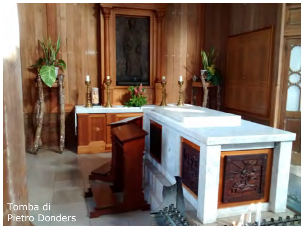
Tomba di Pietro Donders

Dopo l'avvio della procedura di beatificazione nel 1900, le spoglie di Pietro Donders furono trasferite a Paramaribo. Dal 2010 le reliquie sono lì sepolte in una nuova tomba nella cattedrale-basilica.