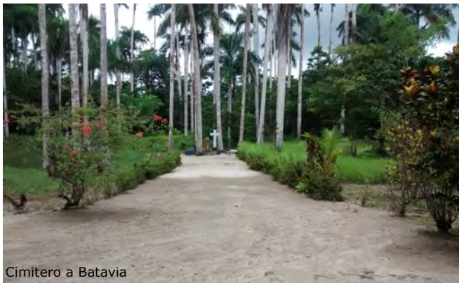
Cimitero a Batavia

Accompagnò molti defunti al cimitero dove alla fine anche lui fu sepolto.